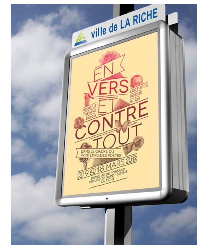
Affiche la culture depuis plus de 20 ans.