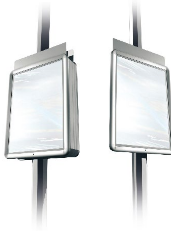
Serrure à clé