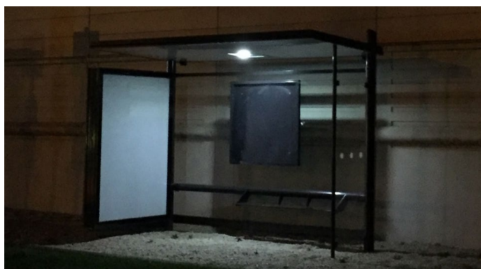
L'assurance d'être vu

Électronique de gestion et de régulation de charge avec batteries.