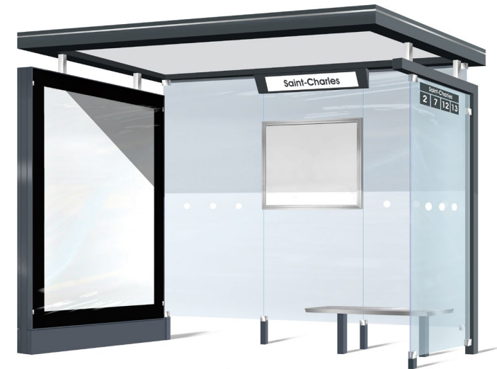
ABRI À SCELLER